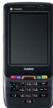
カシオ計算機製 業務用 PDA 「DT-5300」