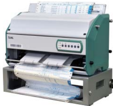
指定伝票発行プリンタ「PS-9010」

～ハンディターミナルとソフトウェアとの組み合わせで、車載在庫管理から基幹システムとのデータ連携まで実現～